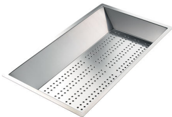
Cuvette perforée en acier inoxydable 8151 000