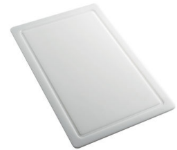
Planche de découpe en HDPE 8657 001