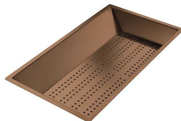
Cuvette perforée en acier inoxydable PVD Copper 8151 008