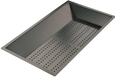
Cuvette perforée en acier inoxydable PVD Gun Metal 8151 006