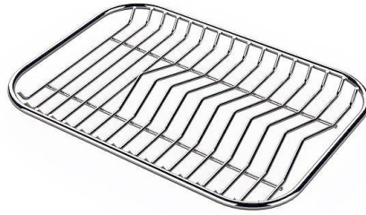
Grille porte-assiettes inox ne peut être utilisé qu'en combinaison avec les accessoires 8644 003 8100 154