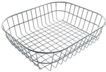
Panier en acier inoxydable 8611 000

* uniquement en combinaison avec l'accessoire 8644 101