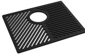
Grille Black 8100 652